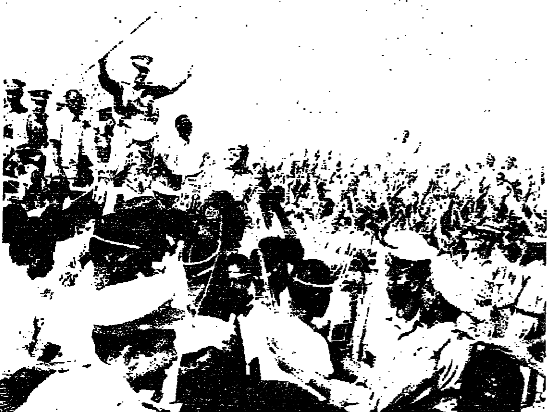
الرئيس السوداني يرد تحية الجماهير